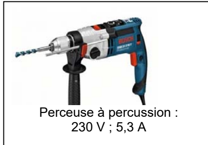
Perceuse à percussion : 230 V ; 5,3 A