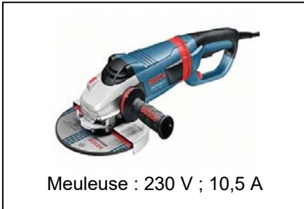
Meuleuse : 230 V ; 10,5 A

On souhaite brancher les appareils et outils suivants sur la console multiprise :