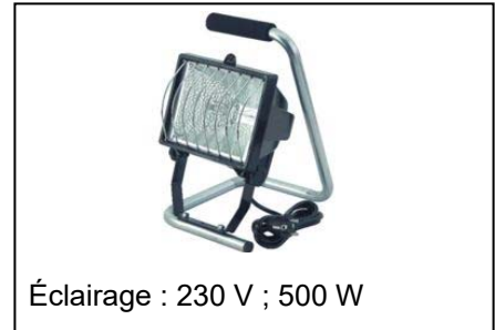
Éclairage : 230 V ; 500 W

Lorsqu'on branche un ou deux appareils sur la console multiprise, ils peuvent fonctionner simultanément. Mais si on souhaite utiliser les 3 appareils en même temps, le disjoncteur coupe le circuit.